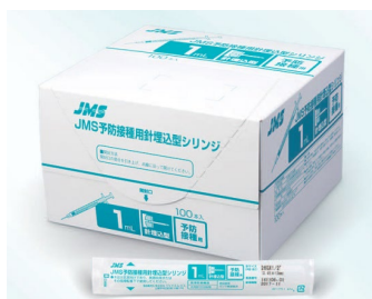
【寄贈した当社製シリンジ】