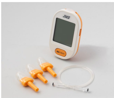
「ペコジーな」スターターキット

当社は、広島県の産官学連携プロジェクト（医療・福祉課題解決に向けたデバイス開発パイロット事業）を通じ、国立大学法人広島大学並びに県内関連企業の皆さまとともに、介護領域や家庭などで手軽に舌圧のトレーニングができるデバイス「ペコジーな」を新たに開発いたしました。楽しくトレーニングを継続できるようアプリと連動させゲームを行うことも可能です。また、既に多くのおお客様にご愛用いただいている舌圧トレーニング用具「ペコぱんだ」においても、今秋新たな硬さ「ペコぱんだ MH」の規格追加を予定しております。