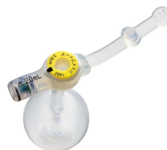
シリコン製 胃ろうカテーテル (バルーンボタンタイプ)