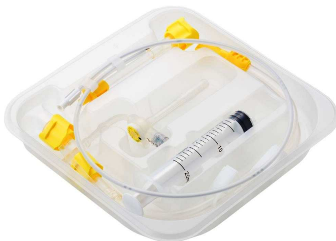
交換用胃ろうカテーテル キット 『ジェイフィード ペグロック』

ジェイ・エム・エスは、経腸栄養関連製品をトータルシステムで取り揃え、より簡単・確実な接続を可能にする Q-LOCK 機構を今後も幅広く展開し、患者さんの安全・安心、医療従事者の皆さんの使いやすさを実現し、医療の現場をサポートしてまいります。